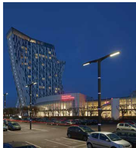
Monopole, Grid Connect Connecté au réseau. En coopération avec Bella Center Copenhagen, Danemark