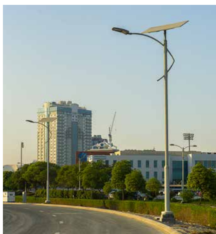
Flatpanel Solution, Stand Alone Autonome, En coopération avec Dubai Sports City, EAU