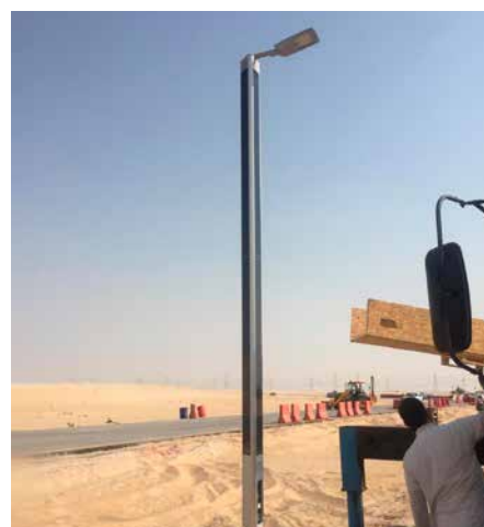
Suncil® Triangular Dammam, Arabie saoudite