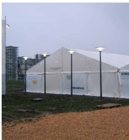
Asima® Sun En coopération avec la COP15 Copenhague, Danemark