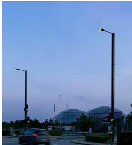
Monopole Randers, Danemark