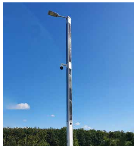
Suncil® Triangular, 8m Randers, Danemark