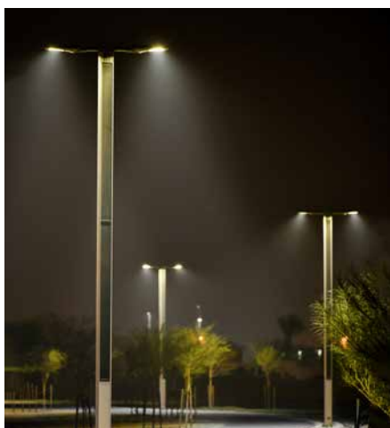
Suncil® Triangular Bras double, éclairant une piste cyclable, EAU