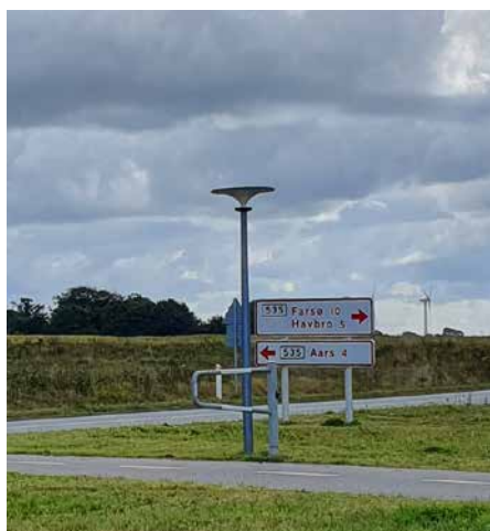
Asima® Sun Municipalité d'Aars, Danemark