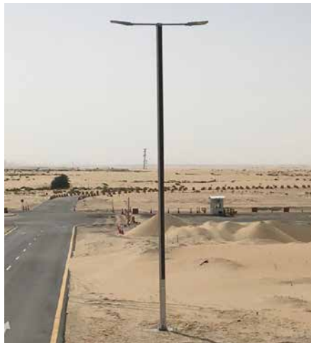
Suncil® Triangular, 12m Arabie Saoudite