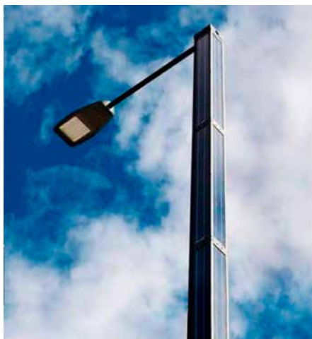
Monopole, Grid Connect Connecté au réseau. En coopération avec la municipalité d'Ebeltoft, Danemark