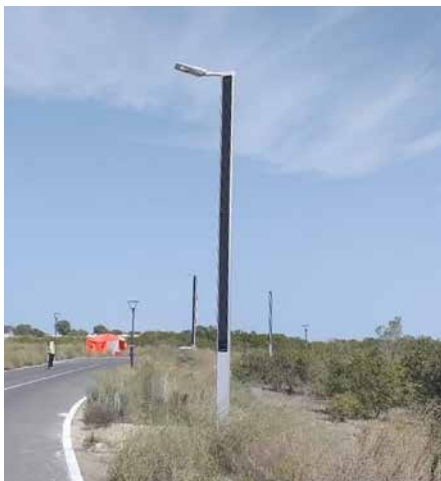
Suncil® Triangular Bras double, éclairant une piste cyclable, EAU