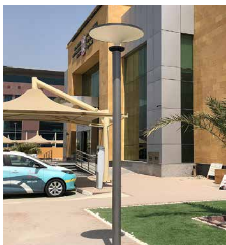
Asima® Sun & Asima® Bollard®, Standalone Autonome, En coopération avec Ministère du développement des infrastructures de Fujairah, EAU