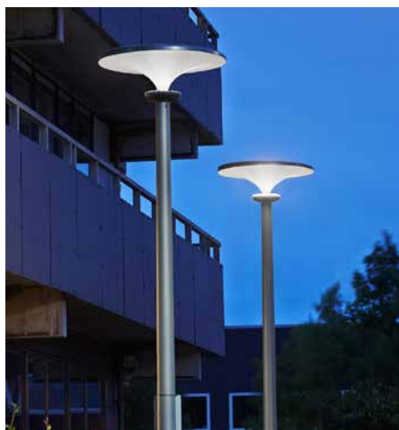
Asima® Sun, Standalone Autonome. En coopération avec Danish Outdoor Lighting Lab, Danemark