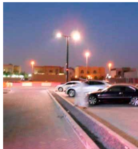
Monopole, Standalone Autonome, En coopération avec DEWA, EAU