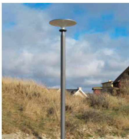
Asima® Sun, Standalone Autonome. En coopération avec la municipalité de Varde, Danemark