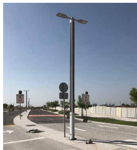
Suncil® Triangular Éclairant une route scolaire, EAU