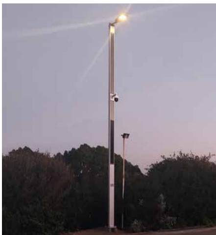
Suncil® Triangular Estela Golf Club, Portugal