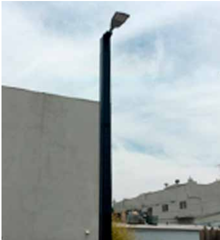
Asima® Sun, Standalone and Monopole Autonome et monopole, En coopération avec la municipalité de Los Angeles