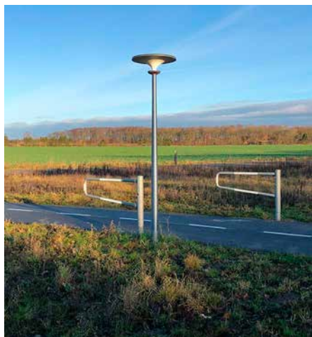
Asima® Sun, Standalone Autonome. En coopération avec Vesthimmerland, Danemark