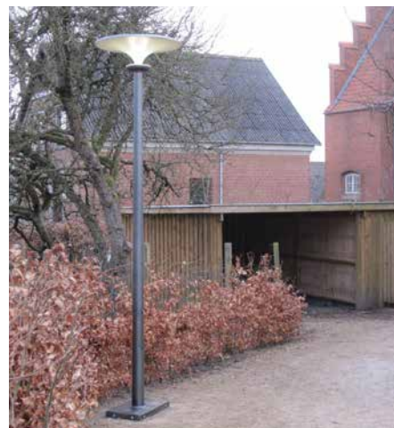
Asima® Sun En coopération avec la municipalité de Tølløse, Danemark