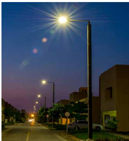
Monopole, Stand Alone Autonome, En coopération avec la municipalité d'Abu Dhabi, EAU