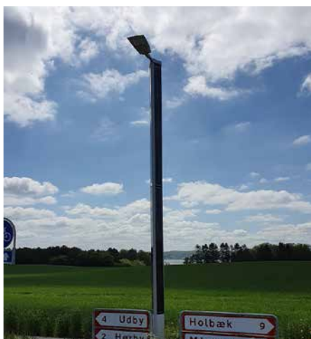
Suncil® Triangular Holbæk, Danemark