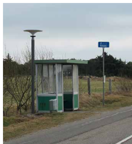
Asima® Sun, Standalone En coopération avec la municipalité de Fanø, Danemark