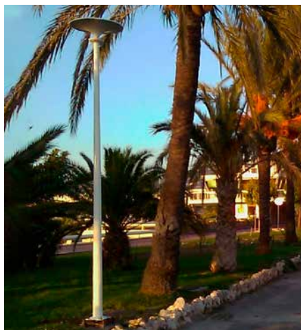
Asima® Sun, Grid Connect Connectée au réseau. En coopération avec la municipalité de Cannes, France