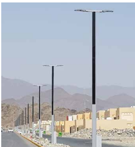
Suncil® Triangular Kalba, EAU