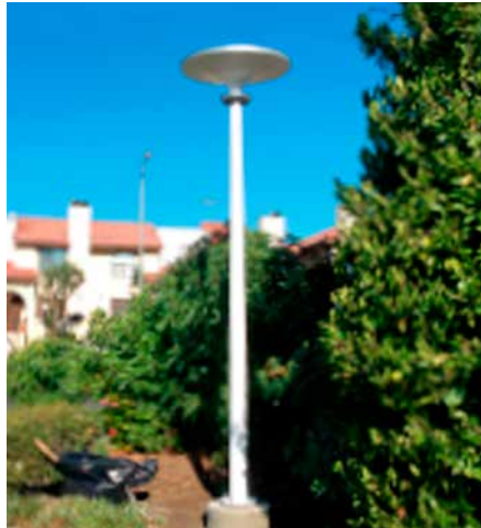
Asima® Sun, Standalone Autonome et monopole, En coopération avec la municipalité de Los Angeles