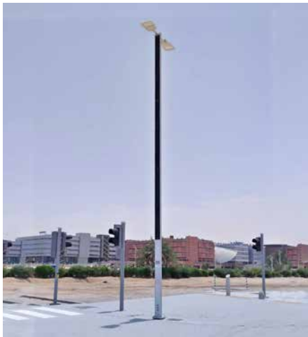
Suncil® Triangular Colonnes solaires élevées pour un boulevard, EAU