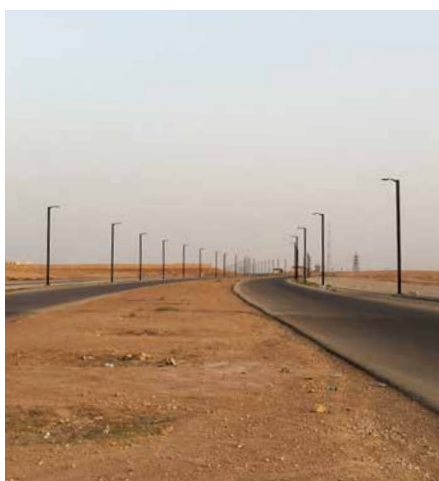
Monopole, Standalone Région Moyen Orient