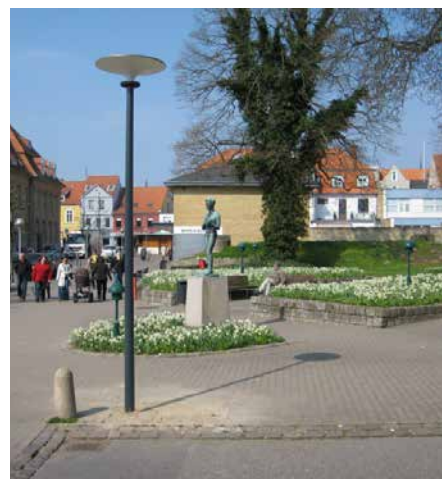
Asima® Sun, Grid Connect Connectée au réseau. En coopération avec la municipalité de Sønderborg, Danemark