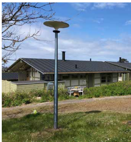
Asima® Sun Gilleleje Ferieby, Danemark