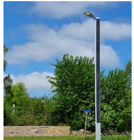
Suncil® Triangular Holbæk, Danemark