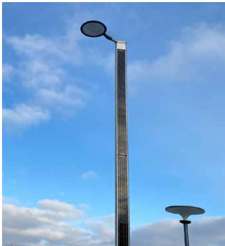
Suncil® Triangular, 6m Randers, Danemark