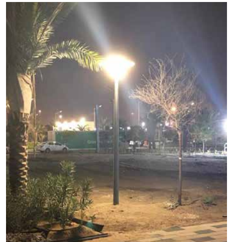
Asima® Sun Abu Dhabi, EAU