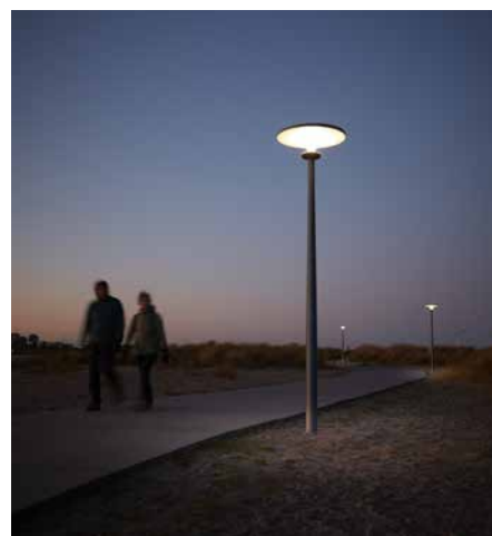
Asima® Sun Amager Strandpark, Copenhague, Danemark