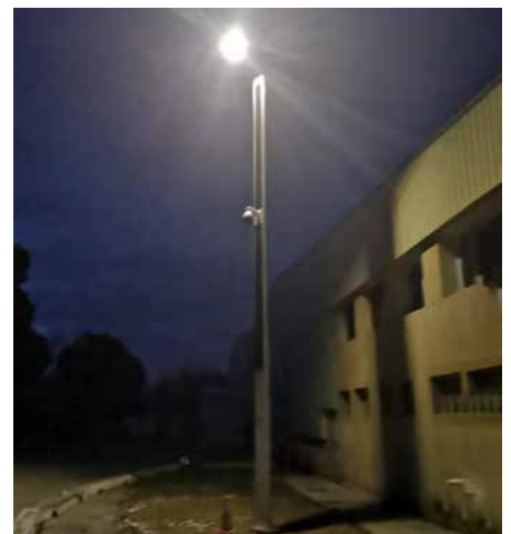
Suncil® Triangular Saint-Rémy-de-Provence, France