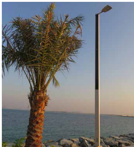
Suncil® Triangular Région ouest, EAU