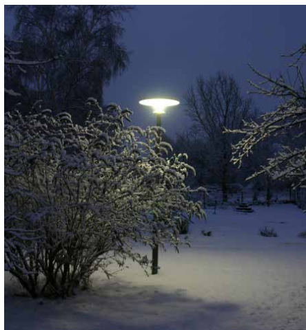
Asima® Sun, Standalone Autonome. En coopération avec la municipalité de Græsted, Danemark