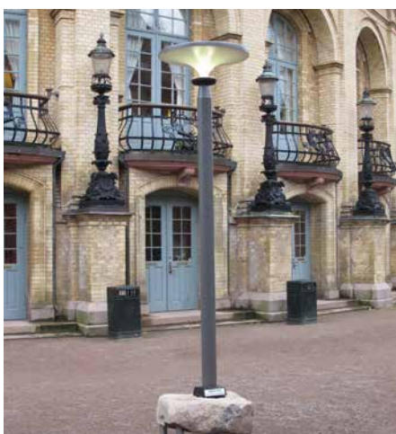
Asima® Sun En coopération avec la municipalité de Landskrona, Suède