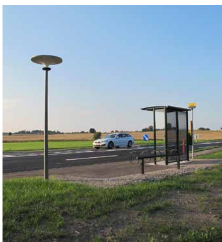
Asima® Sun, Standalone Autonome. En coopération avec la municipalité de Gribskov, Danemark