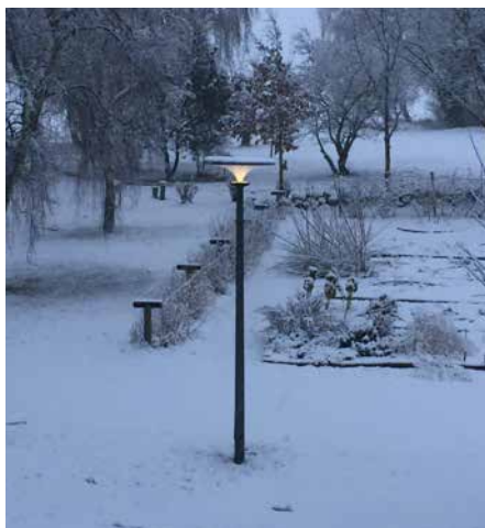
Asima® Sun En coopération avec Lyhne Design, Danemark