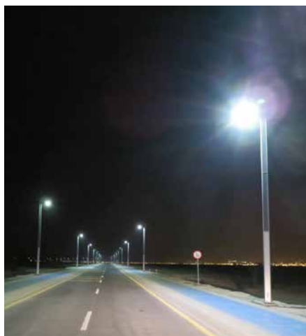
Suncil® Triangular Région ouest, EAU