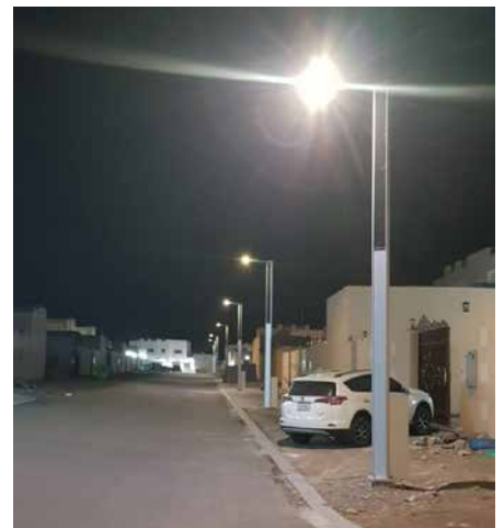
Suncil® Triangular Quartier des villas d'Al Safa, EAU