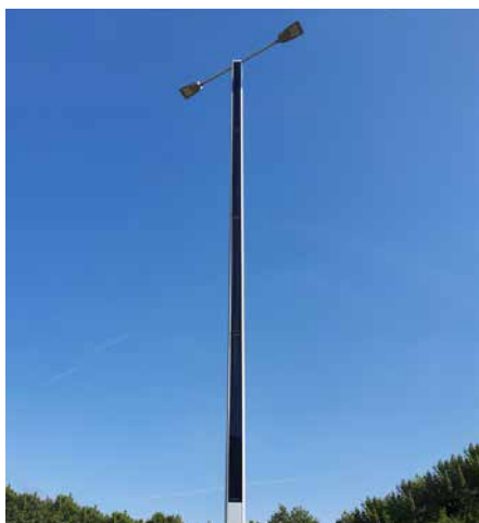
Suncil® Triangular, 12m Randers, Danemark