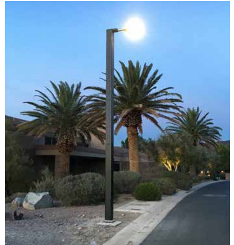
Monopole, Standalone Autonome En collaboration avec Macdonald Highlands, Nevada